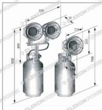
Рис. 2. Внешние размеры нагревателей в собранном виде.