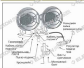
Рис.3. Внешний вид нагревателя. Звездочкой обозначены элементы, присутствующие у моделей с пьезо-поджигом.

ВНИМАНИЕ! Регулятор подачи газа и вентиль баллона должны всегда находиться сбоку либо сзади от направления излучения тепла камерой сгорания!